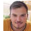
Frederic Karberg Mack & Schühle AG